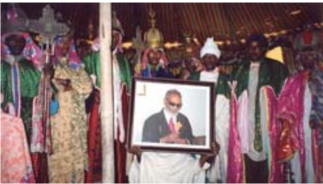
በዲማ ቅዱስ ጊዮርጊስ ቤተ ክርስቲያን የአርባ ቀን መታሰቢያ።

በዚህ መሠረት፤ ትልቁ የዐፄ ምኒልክ ድንኳን፤ የተለያዩ ቅርጽና መጠን ያላቸው ድባቦችና ጥላዎች፤ የነገሥታትና የመኳንንት ዘውዶችና አክሊሎች፤ የክብር አልባሳት ለሥነ ሥርዓቱ ማጀቢያነት እንዲውሉ ከግምጃ ቤት ወጥተው በድንኳኑ ውስጥና ዙሪያ እንዲታዩ ተደርገዋል።