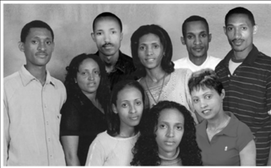
የቤተ ሰብ የኅዘን ወመከጣዎች።