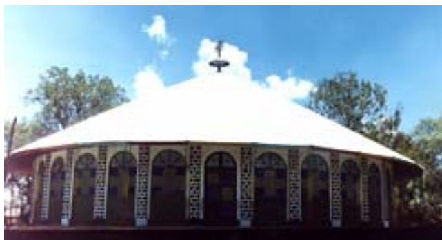
ዲማ ቅዱስ ጊዮርጊስ ቤተ ክርስቲያን።